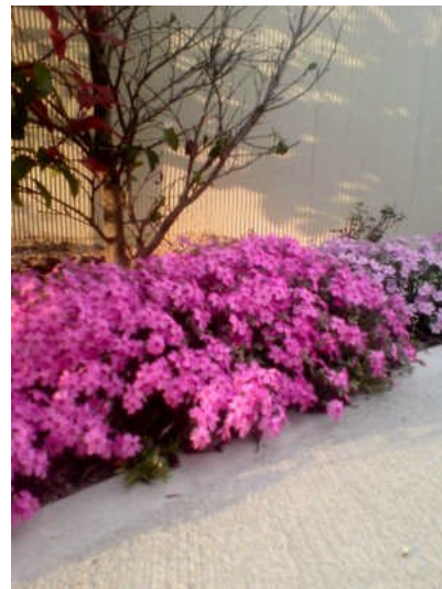
(家の庭に芝桜が咲きました)

また対戦時の写真等も送られたものは全てリーグ情報誌&HP に載せていきたいと思いますので、どんどんデジカメや携帯で写真を撮って送っていただきたいと思います。